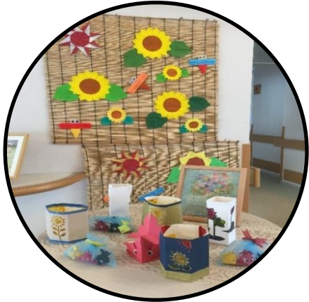
▲ケアハウス玄関も夏でお出迎え