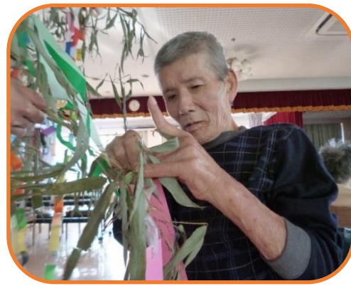
▲一生懸命に飾り付けしています