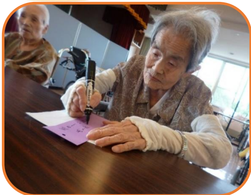
▲健康と長寿をお願いされました