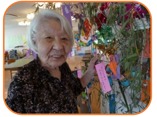
▲七夕飾りに満面の笑み