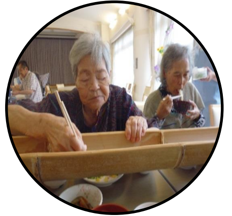
▲「逃がさんぞ」とばかりの真剣な表情