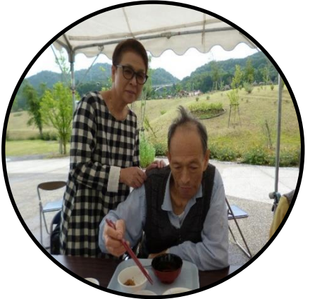
▲娘さんの想いを背に箸が進みます