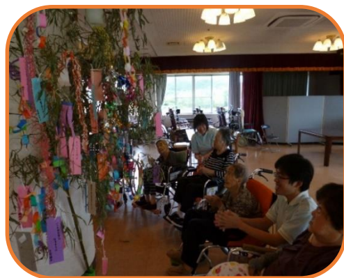
▲完成した笹竹の前で七夕の歌を合唱