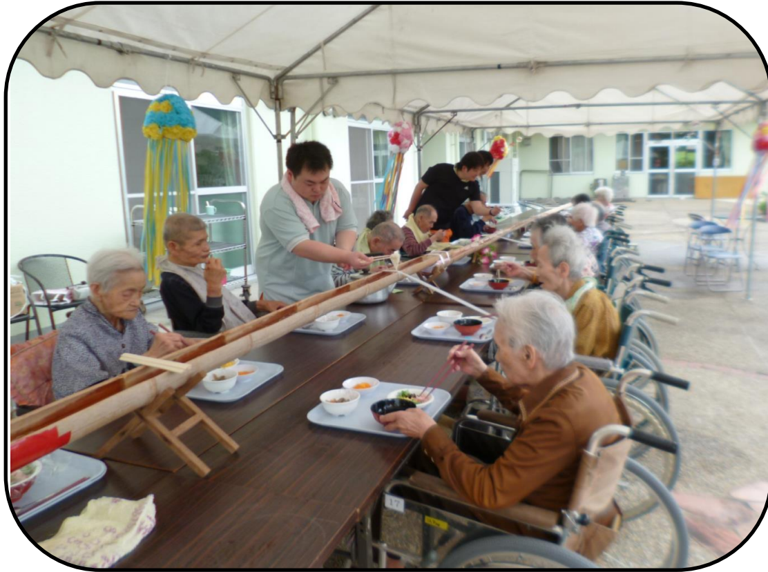
▲「夏の風物詩」ソーメン流しで暑気払い