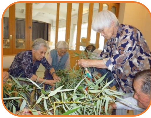
▲一つ一つ願いを込めて飾ります