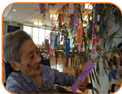
▲七夕飾りにうっとり