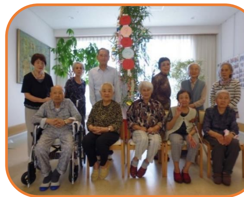
▲飾り付け後に記念写真