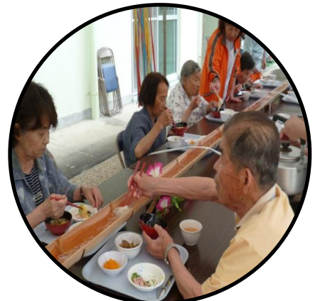
▲ソーメンを見事にキャッチ